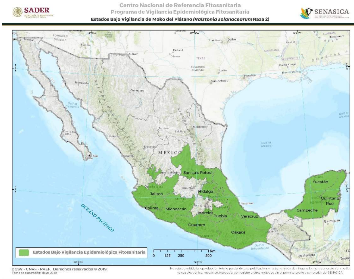
Figura 3. Estados donde se realiza actualmente la vigilancia de Ralstonia solanacearum raza 2 en México. Elaboración propia con datos de SADER-SENASICA-PVEF, 2019b.

Huimanguillo, Tacotalpa y Teapa, respectivamente; lo anterior con el objetivo de reducir el riesgo de dispersión y niveles de infestación en las zonas sin presencia y bajo control fitosanitario mejorando con ello, su estatus fitosanitario (SADER-SENASICA-PVEF,2019b) [Figura 3].